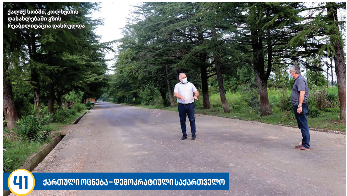
ქალაქ სოხში, კოლხეთის დასახლებაში გზის რეაბილიტაცია დასრულდა

41 ქართული ოცნება – დემოკრატიული საქართველო