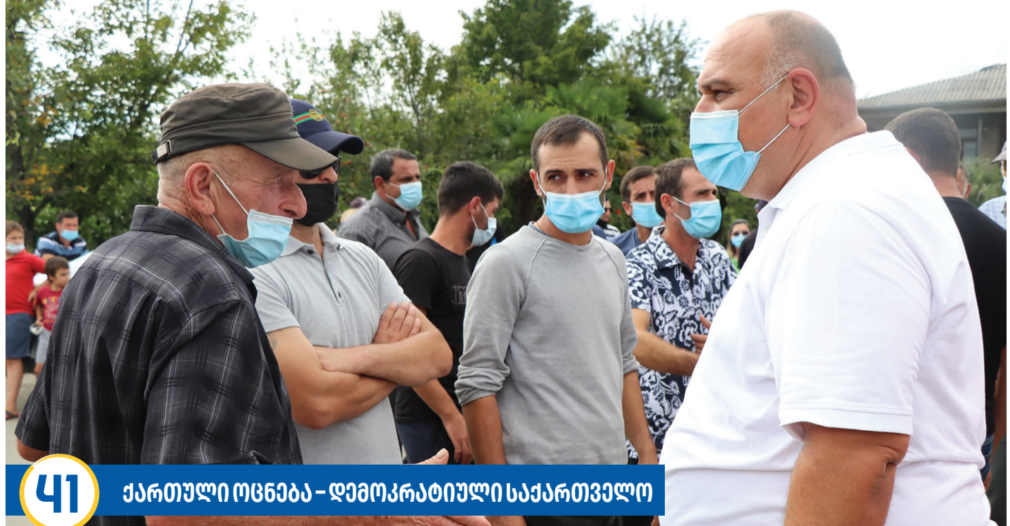
41 ქართული ოცნება – დემოკრატიული საქართველო

– გამომდინარე იქიდან, რომ რამდენიმე წელია ძალიან სტრუქტურულად ადარ ვარ, გიპასუხებთ როგორც რიგითი, პროფესიით იურისტი ადამიანი – ადამიანის კონსტიტუციური უფლებები დღეს ყველაზე მეტად არის დაცული და განმტკიცებული. ყველას აქვს გამოხატვის, სიტყვის თავისუფლება. ქუჩაში ადარ ძალადობენ, არ აყაჩაღებენ. მნიშვნელოვანია ისიც, რომ სამართალდამცავებს ყველანაირი პირობა აქვთ შექმნილი ეფექტიანად მუშაობი-