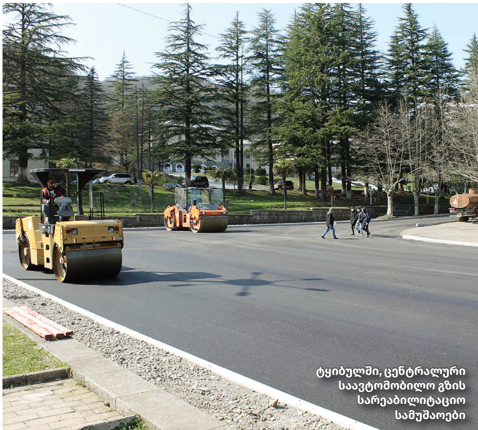
ტყიბულში, ცენტრალური საავტომობილო გზის სარეაბილიტაციო სამუშაოები