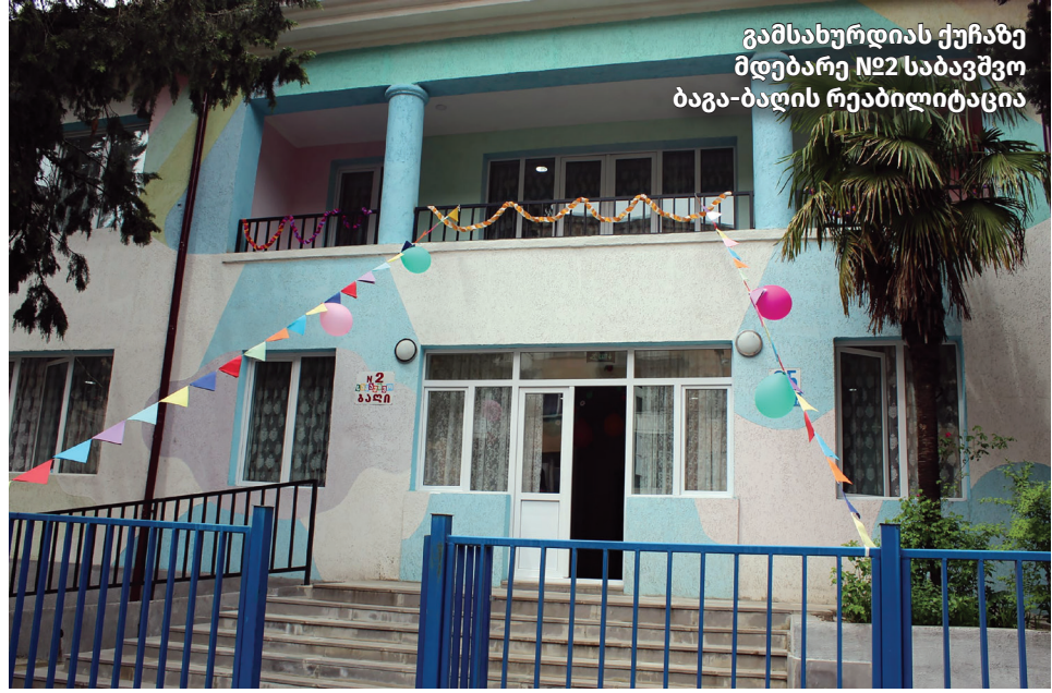
გამსახურდის ქუჩაზე მდებარე №22 საბავშვო ბაგა-ბაღის რეაბილიტაცია

განათლების სისტემის განვითარება „ქართული ოცნების“ ერთ-ერთი უმნიშვნელოვანესი პრიორიტეტი. 2012 წლის შემდეგ, საქართველოში განხორციელდა ფუნდამენტური სისტემური ცვლილებები მაღალი ხარისხის განათლების ხელმისაწვდომობის უზრუნველსაყოფად. მათ შორის, შეიქმნა განათლების სისტემის ფინანსური მდგრადობის უზრუნველყოფი საკანონმდებლო გარანტიები, დაიხვეწა ადრეული და სკოლამდელი აღზრდისა და განათლების სისტემის მარკეტული რეაბილიტაცია, დადგინდა და დაინერგა ძირითადი სტანდარტები.