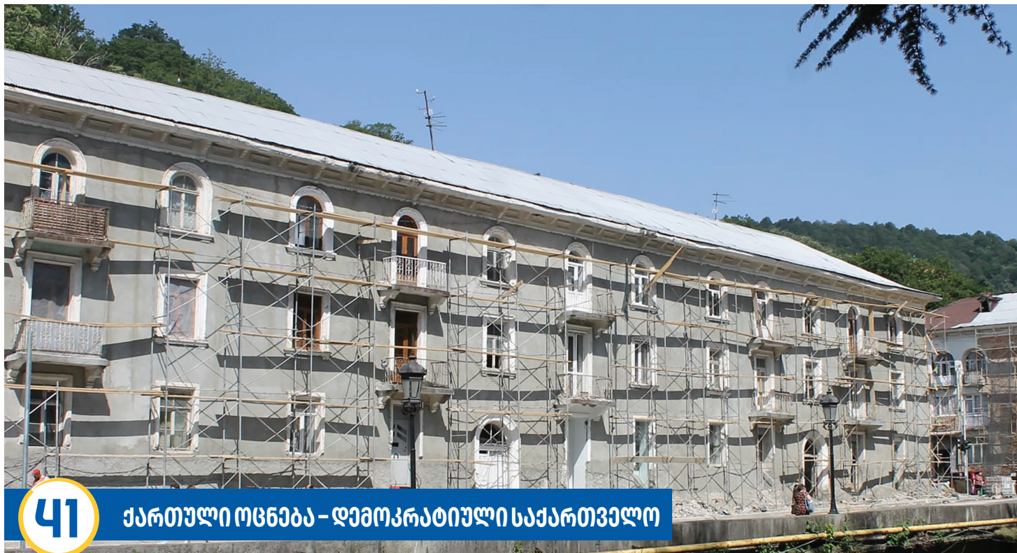
41 ქართული ოცნება – დემოკრატიული საქართველო

ტყიბულის მუნიციპალიტეტში, 2013-2021 წლებში, გაზიფიცირებულია, ჯამურად 9 067 აბონენტი. მიმდინარე წელს დაგეგმილია სამუშაოები 8 სოფლის (დაბაძველი, ძუყნური, ლეღვა, ხრესილი, ქვედა ყყეპი, ზედა ყყეპი, ჯონია, ბუეთი) ტერიტორიაზე (685 აბონენტი). 2022 წელს იგეგმება სოფელ ცუცხვათის გაზიფიცირება (280 აბონენტი). 2013-2017 წლებში, ელექტროენერჯის ინდივიდუალური მრიცხველი 5131 აბონენტს დაუმონტაჟდა, რითაც მოსახლეობის ელექტროენერჯით უზრუნველყოფის საკითხი სრულად მოწესრიგდა.