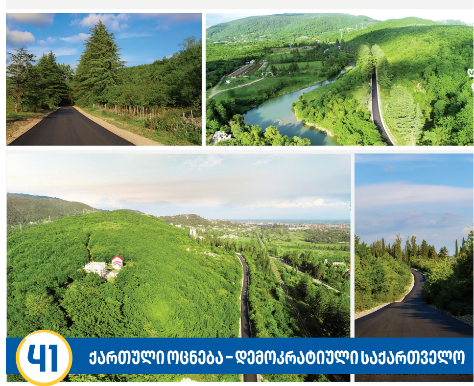
41 ქართული ოცნება – დემოკრატიული საქართველო