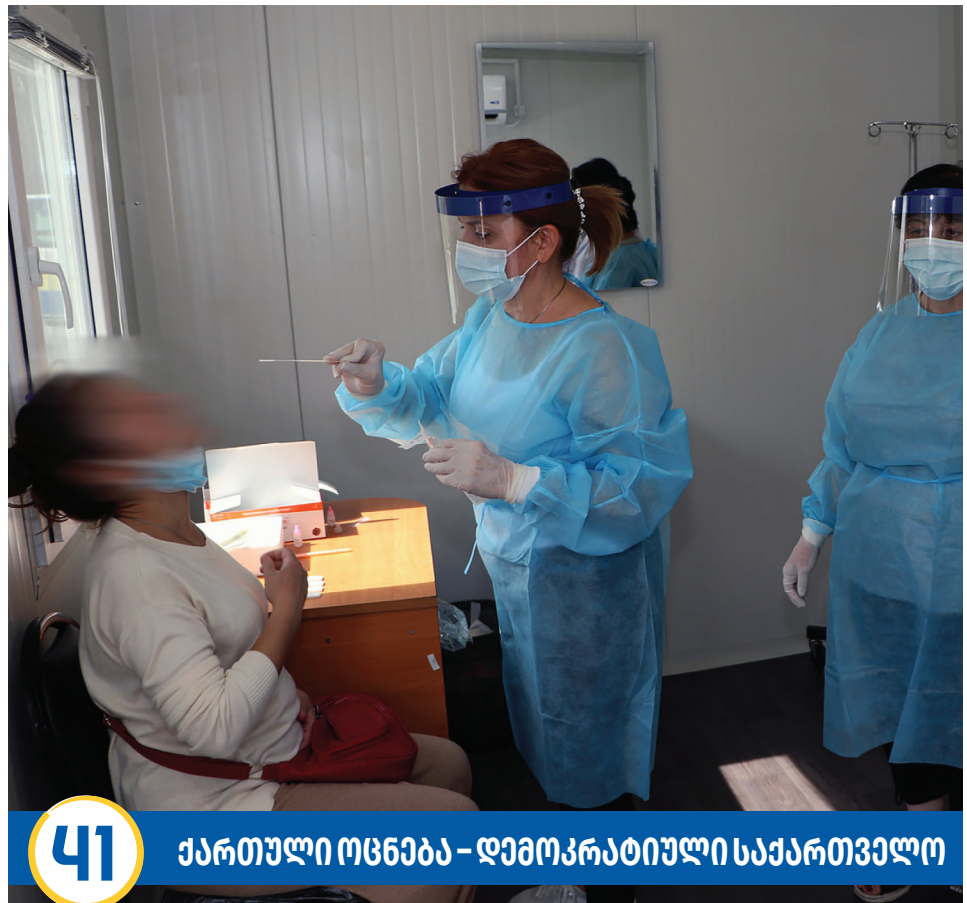
41 ქართული ოცნება – დემოკრატიული საქართველო