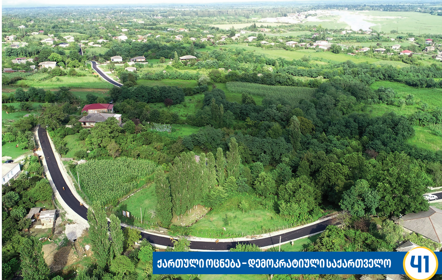
სენაკში თამარის ქუჩის სრული რეაბილიტაცია

2014-2020 წლებში, სენაკის წყალმომარაგებისა და საკანალიზაციო ქსელის განვითარება, მუნიციპალური და ცენტრალური ბიუჯეტიდან ჯამურად, 9 მილიონ ლარზე მეტით დააფინანსა. ხელისუფლების გეგმით, 2021-2023 წლებში, მუნიციპალიტეტის წყალმომარაგების გაუმჯობესების მიზნით, დამატებით 3,5 მილიონ ლარზე მეტი დაიხარჯება. სენაკში უკვე მიმდინარეობს ან იგეგმება შემდეგი წყალმომარაგების პროექტები: სენაკი, სოფ. გოლასკური, ზემო ჭალადიდი, ხორვიში, ქვემო ქვალონი - წყალმომარაგების ქსელის რეაბილიტაცია/პროექტირება-მშენებლობა - 2 418 627.00 ლარი; ქ. სენაკის ქუჩებისა და სოფ. მენჯის წყალმომარაგების სისტემის რეაბილიტაცია/პროექტირება-მშენებლობა - 1 254 776.00 ლარი.