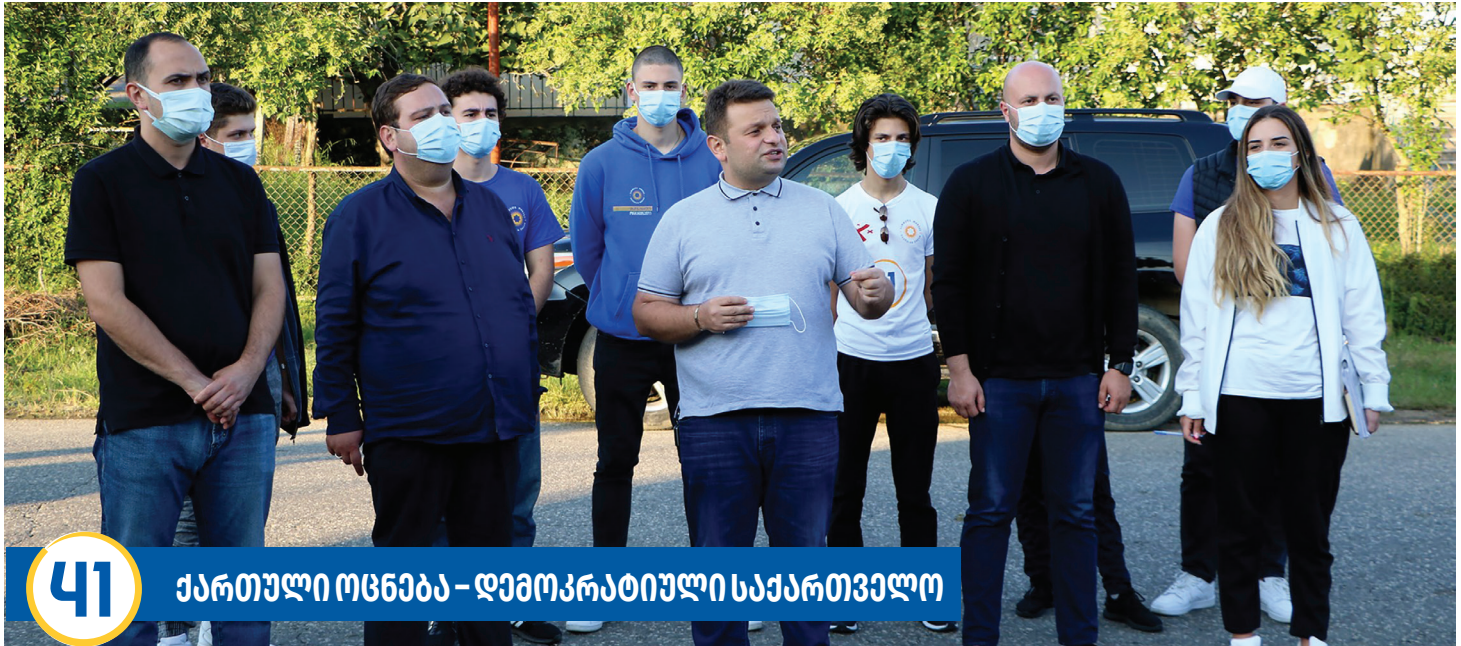
41 ქართული ოცნება – დემოკრატიული საქართველო

– ივანე ჯავახიშვილის სახელობის თბილისის სახელმწიფო უნივერსიტეტთან არსებული სკოლა „ჰარმონია“ დავამთავრე. ტექნიკური საგნები მაინ-