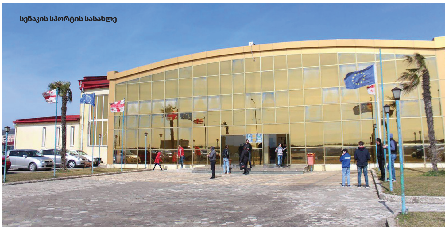
სენაკის სპორტის სასახლე

განხორციელდა მუნიციპალიტეტის სპორტული ობიექტების მშენებლობა-რეაბილიტაციის არაერთი პროექტი. მათ შორის: ლეძაძამე, სტადიონის შეღობვა (2,5 ათასი ლარი); გეჯეთი, სტადიონის შეღობვა (5,9 ათასი ლარი); ლეძაძათურე, სპორტული მოედნის შეღობვა (4,7 ათასი ლარი); ზანა, სტადიონის ჭიშკრისა და ღობის რემონტი (0,7 ათასი ლარი); ფოცხო-ნასაჯუ, ბუნებრივსაფარიანი მინიმოდენის მოწყობა (9,9 ათასი ლარი); ზანა, ფრენბურთის მოედნის რეაბილიტაცია