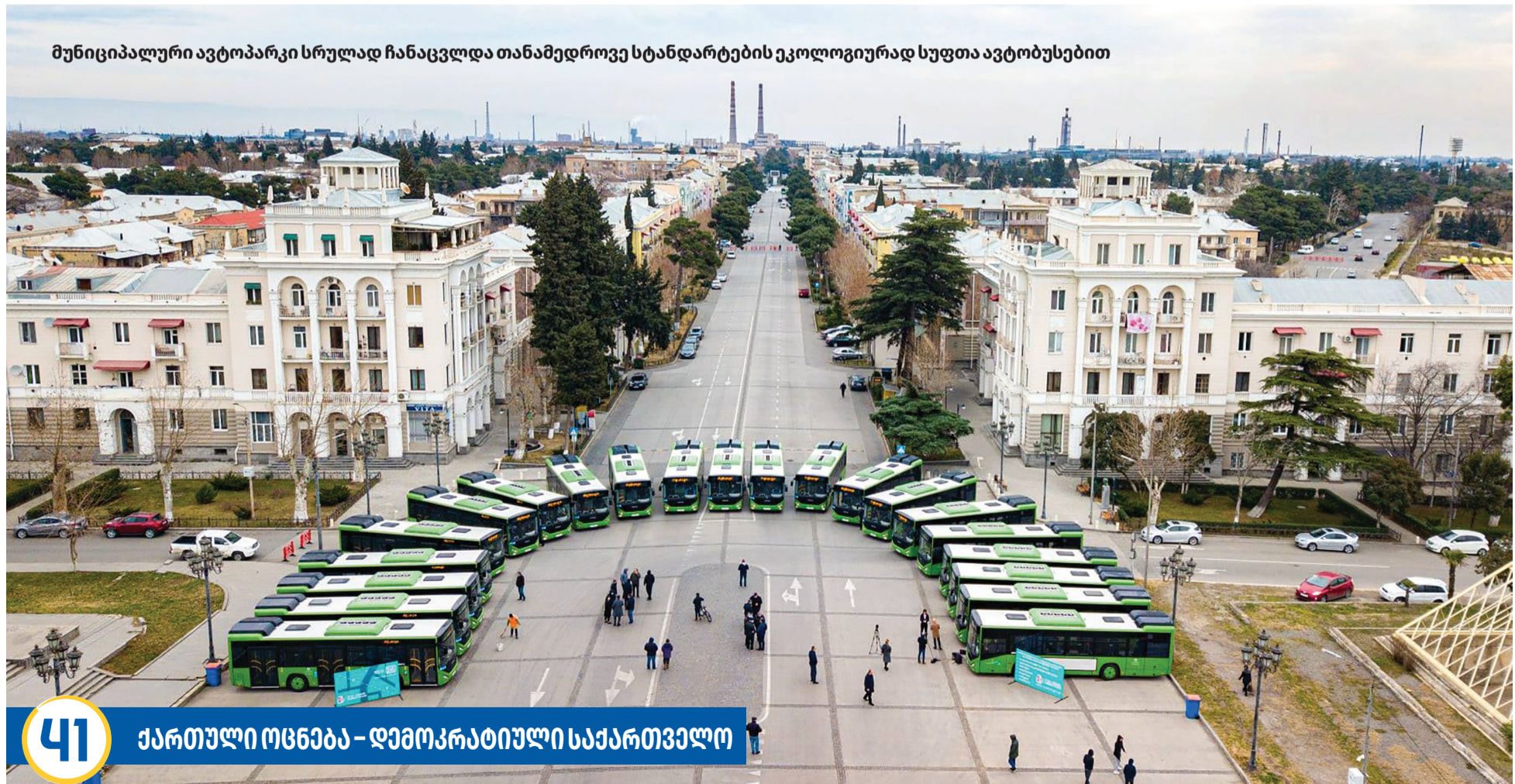
მუნიციპალური ავტოპარკი სრულად ჩანაცვლდა თანამედროვე სტანდარტების ეკოლოგიურად სუფთა ავტობუსებით

2020 წლის მდგომარეობით, მოწესრიგებულია მუნიციპალური გზების დაახლოებით 80%, 2021 წელს დამატებით მოწესრიგდება 7%. 2021 წლის ბიუჯეტში რეგიონული განვითარების ფონდიდან დაფინანსდება, დაახლოებით 5 120 ათასი ლარი, ხოლო ადგილობრივი ბიუჯეტით 877,9 ათასი ლარი.