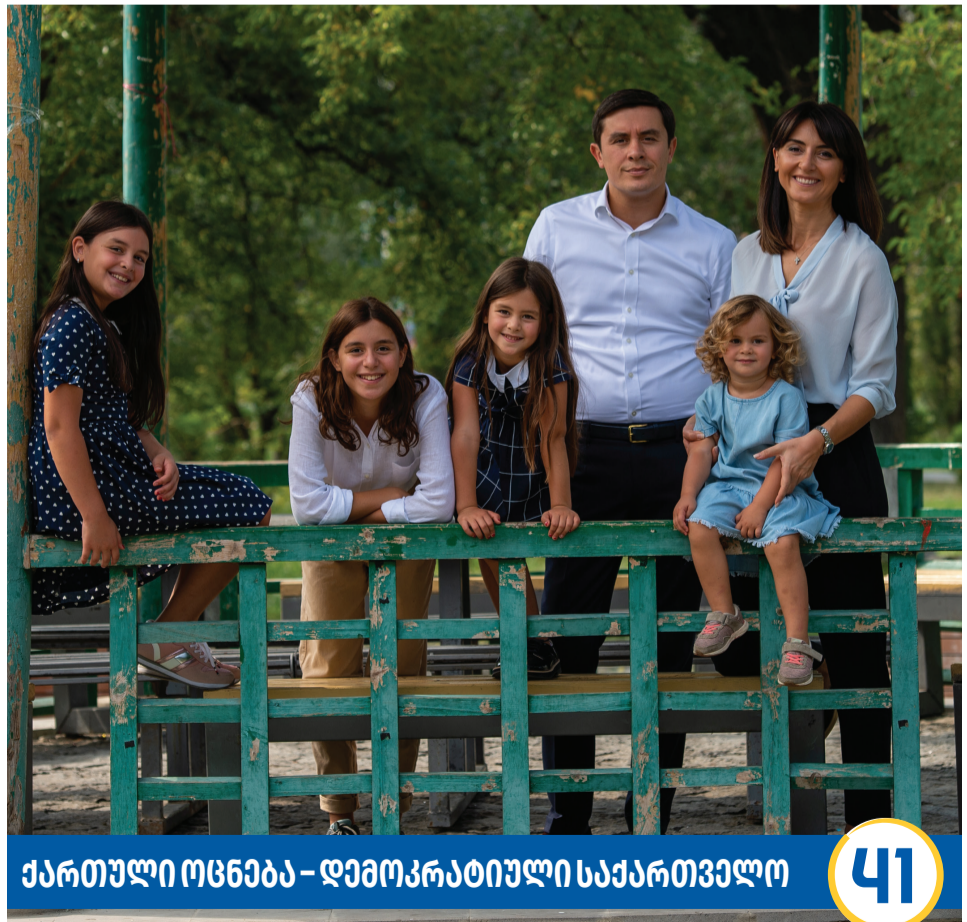
ქართული ოცნება – დემოკრატიული საქართველო 41

– რა თქმა უნდა. დარწმუნებული ვარ, რომ ჩვენი გუნდი ღირსეულ გამარჯვებას მოიპოვებს, რადგან თანამოაზრეებთან ერთად, ახალი გეგმებით, მერიის პოზიციიდან თითოეული რუსთაველისთვის კონკრეტული სასიკეთო ცვლილებების განხორციელების ბევრად მეტი შესაძლებლობა მექნება.