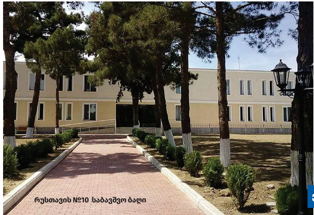
რუსთავის №10 საბავშვო ბაღი