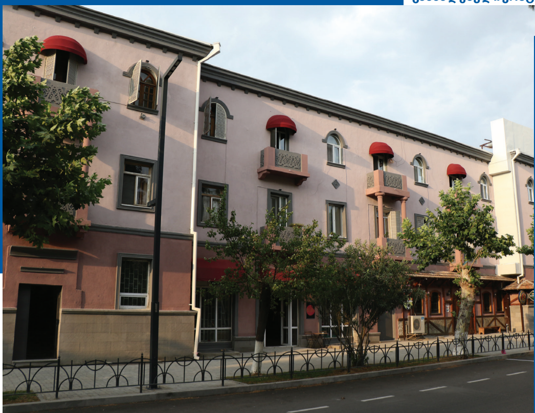
განახლებული კოსტავას გამზირი