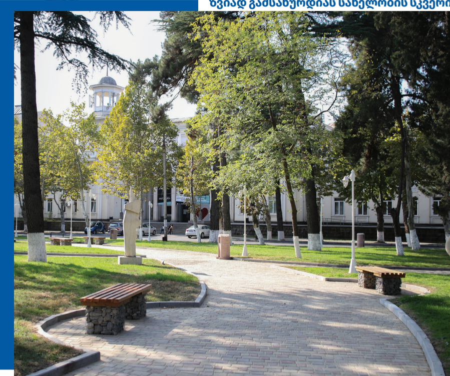
ზვიად გამსახურდიას სახელობის სკვერი