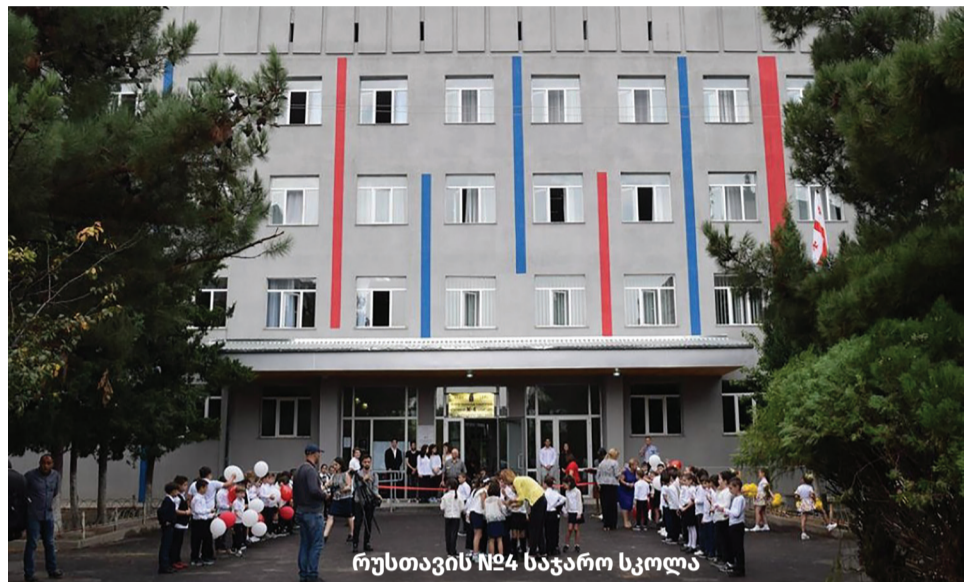
რუსთავის №4 საჯარო სკოლა

განათლების სისტემის განვითარება „ქართული ოცნების“ ერთ-ერთი უმნიშვნელოვანესი პრიორიტეტი. 2012 წლის შემდეგ, საქართველოში განხორციელდა ფუნდამენტური სისტემური ცვლილებები მაღალი ხარისხის განათლების ხელმისაწვდომობის უზრუნველსაყოფად. მათ შორის, შეიქმნა განათლების სისტემის ფინანსური მდგრადობის უზრუნველყოფი საკანონმდებლო გარანტიები, დაიხარჯა ადრეული და სკოლამდელი აღზრდისა და განათლების სისტემის მარკეტული რეაბილიტაციის კანონმდებლობა, დადგინდა და დაინერგა ძირითადი სტანდარტები.