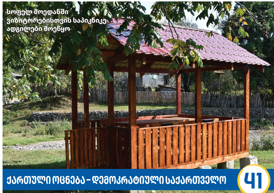
სოფელ მოედანში ვიზიტორებისთვის საპიკნიკე ადგილები მოეწყო