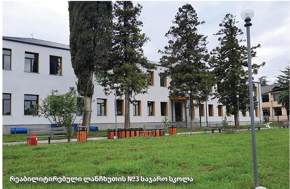
რეაბილიტირებული ლანჩხუთის №3 საჯარო სკოლა

განათლების სისტემის განვითარება „ქართული ოცნების“ ერთ-ერთი უმნიშვნელოვანესი პრიორიტეტი. 2012 წლის შემდეგ, საქართველოში განხორციელდა ფუნდამენტური სისტემური ცვლილებები მაღალი ხარისხის განათლების ხელმისაწვდომობის უზრუნველსაყოფად. მათ შორის, შეიქმნა განათლების სისტემის ფინანსური მდგრადობის უზრუნველყოფი საკანონმდებლო გარანტიები, დაიხვეწა ადრეული და სკოლამდელი აღზრდისა და განათლების სისტემის მარკეტულირებადი კანონმდებლობა, დადგინდა და დაინერგა ძირითადი სტანდარტები.