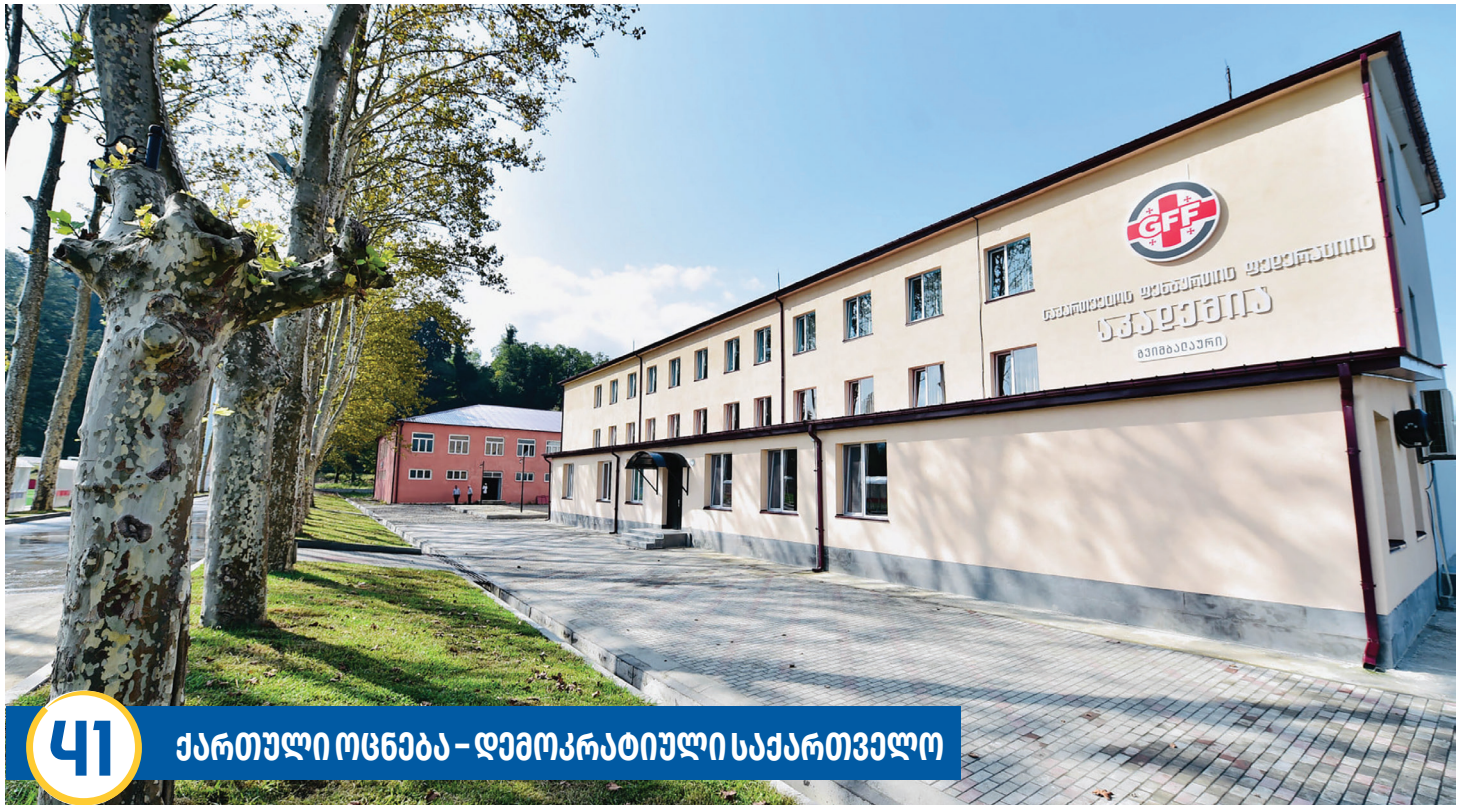
41 ქართული ოცნება - დემოკრატიული საქართველო

საფეხბურთო სკოლის ჭაბუკ ფეხბურთელთა გუნდებმა , 2018-2020 წლებში