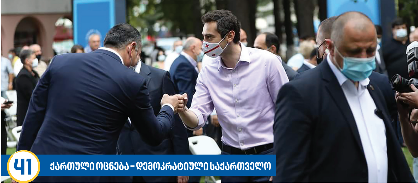
41 ქართული ოცნება - დემოკრატიული საქართველო

ლებს და არის ადაპტირებული. ასევე, მუნიციპალიტეტის მასშტაბით დავიწყეთ სკოლებში სველი წერტილების მოწესრიგება, გამოცვალეთ რამდენიმე სკოლის სახურავი... მშენებლობები არ გაჩერდება და განათლების კუთხით სარეაბილიტაციო სამუშაოები ეტაპობრივად გაგრძელდება ყველა სკოლაში, რადგან ჩვენ მომავალ თაობას განათლების მისაღებად ჰქონდეს სათანადო გარემო. გარდა ამისა, ჩვენთან, ლანჩხუთის ცენტრში დაწყებულია პროფესიული სასწავლებლის მშენებლობა. 1990-იან წლებამდე ლანჩხუთში არსებობდა მსგავსი ტიპის სასწავლებელი, მაგრამ შემდეგ განვითარებულმა პროცესებმა მათი გაუქმება გამოიწვია და ფაქტობრივად, ყველგან ნანგრევები დადარჩა. ახალი პროფესიული სასწავლებელი ჩვენი მუნიციპალიტეტისთვის საჭირო აუცილებელ პროფესიებს შესწავლის არა მხოლოდ ახალგაზრდებს, არამედ ყველა იმ ადამიანს, ვინც ამა თუ იმ პროფესიის დაუფლებით იქნება დაინტერესებული. ამ ეტაპზე ჩვენ პროფესიულ კოლეჯში შვიდი პროფესიის შესწავლა იქნება შესაძლებელი. რა თქმა უნდა, მუნიციპალიტეტის მოთხოვნიდან გამომდინარე, პროფესიები სამომავლოდ დაემატება და 2022 წლისთვის სასწავლებელი შეძლებს მიიღოს სტუდენტები.